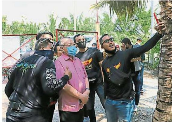
林吉祥（中）所到之处，皆引来多人争相合照，包括来自外地的摩托车骑士游客。