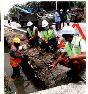
SPAN workers unearthing an illegal pipe connection during an operation in Banting.

Kirgapakaran says SPAN officers are always on site to follow up on complaints. Those caught stealing water will be investigated under Section 123 (1) of the Water Services Industry Act 2008, which carries a fine of up to RM100,000 or a one-year jail term or both. The act states that no one, other than the licensee, can make an extension from public water pipes. Members of the public who have seen or know of any leakage and broken pipes, illegal pipe connections or meters manipulated are encouraged to immediately lodge a report with SPAN's Enforcement Department at 03-6117 9333 or email ata@span.gov.my