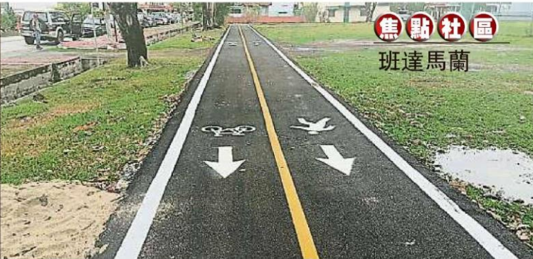
焦點社區 班達馬蘭

班达马兰池龙花园的公园跑道上，于2月时已画上人行道和脚车道，方便居民在公园运动。