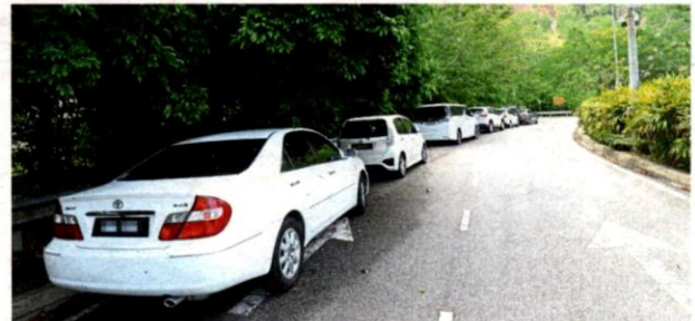
Cars parked along Persiaran Hijauan Residence by hikers heading into Apek Hill in Cheras are an inconvenience to nearby residents.

"We have also been told that the department limits the number of visitors to the hill at only 100 a day," he said, adding that MPKJ was in talks with the department to instal signboards to remind visitors to apply for a permit before entering the hill. — By FARID WAHAB