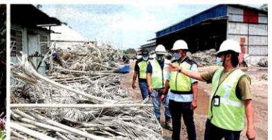
SPAN's enforcement team at the scrapyard where an illegal water connection was discovered in Telok Panglima Garang.