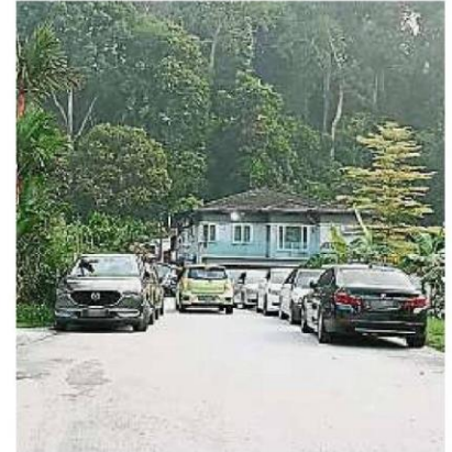
花园通道左右两旁泊满登山者的轿车，同一时间只允许一辆轿车进出。