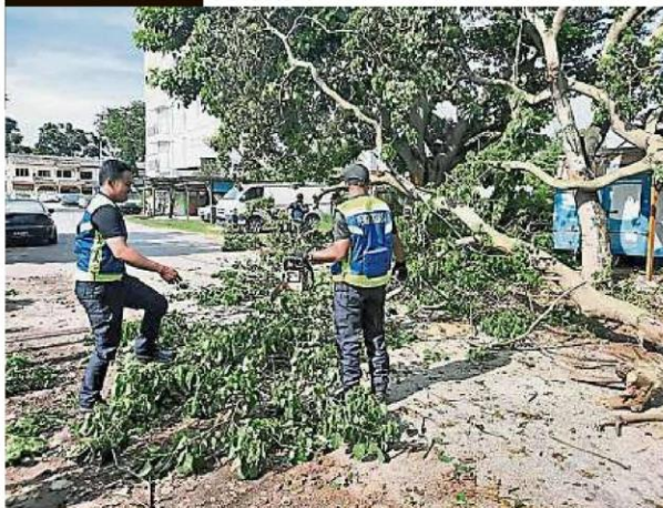
班达马兰池龙花园的幸福巷的大树倒下后，已被市议会“快速队”快速清理。