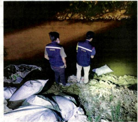
KAKITANGAN LUAS meletakkan 10 beg serbuk karbon teraktif di Sungai Batang Benar di Negeri Sembilan bagi mencegah pencemaran.

Jelas beliau, tiada sebarang henti tugas LRA Sungai Semenyih seterusnya berjaya mengelak sebarang gangguan bekalan air kepada pengguna.