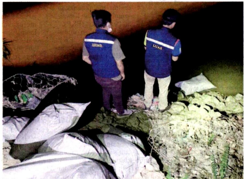
LUAS meletakkan 10 beg di Sungai Batang Benar untuk mencegah sebarang pencemaran bau dalam air mentah.

"Siasatan LUAS mendapati jarak insiden tersebut ke muka sauk Jende-