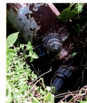
An illegal extension used to divert water from the main pipe.